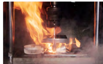
つぶされたバッテリーの発火事故の再現

リチウムイオンバッテリーは外部からの衝撃が加わり、へこむなどすると内部ショートが生じ、発煙や発火につながります。リチウムイオンバッテリーを搭載した製品は小型のものも多く、手をすべらせて落下させたり、ポケットに入れたまま座って体の下敷きにしたりなどして事故となることがあります。外部からの衝撃が加わることのないよう注意しましょう。