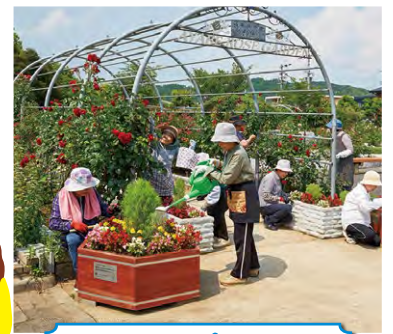
フラワープランター