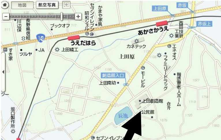
上田創造館 (上田市上田原 1640)