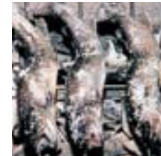
イワナ料理 静かな清流にしか生息しない幻の魚「岩魚」は、野趣に富んでいます。塩焼きや骨酒、甘露煮など味わい色々。