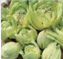
ふきのとう 天ぷらやふき味噌で苦味のある春の香りを楽しめます。