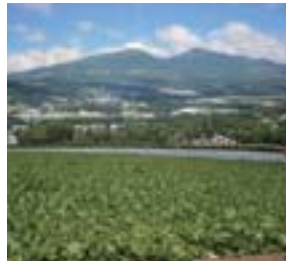
高原野菜 夏の涼やかな気候と日照時間の長さを生かして、高品質の高原野菜の生産が行われています。