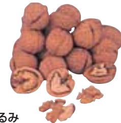
くるみ 全国一の生産量を誇る上田地域では、おかしやおはきから、くるみだれそばなどいろいろな食べ物に変化します。