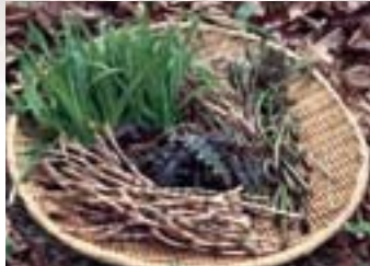
山菜 山の幸、わらび、ゼンマイ、つくし、タラの芽などなど、春の味覚がいっぱいです。