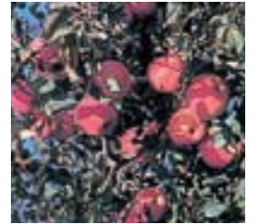
りんご 甘い蜜がたっぷり入ったりんごは、信州の秋の代名詞。ジュースなどの加工品も味わえます。