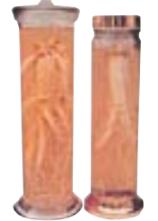
薬用人参 販売できるまでに7年かかる薬用人参は、高貴な薬種として珍重されています。