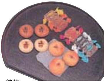
銘菓 上田地域の特産を生かした味わいのある品々が勢揃い。