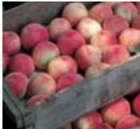
くだもの 上田地域は、夏冬の昼夜の気温差が大きく降水量の少ない内陸性気候で果樹の栽培に最適。甘い香りとみずみずしい味を楽しめます。