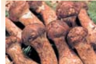
松茸料理 上田地域は、松茸の産地として全国的にも有名です。そんな秋の味覚の王様である松茸は、松茸小屋で採りたての料理を楽しめます。