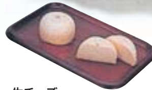
生チーズ 上田地域の自然と風土に恵まれた乳製品は、フレッシュ感といきいきとした乳酸菌の活性を全身で感じられます。