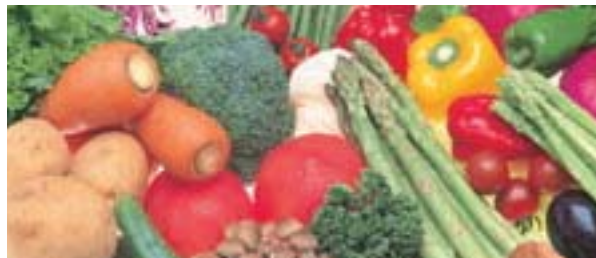
野菜 豊かな大地で育った野菜は、日中の強い日差しと夜の冷涼な気候で柔らかく、取れたての新鮮さがいっそう味を引き立てます。