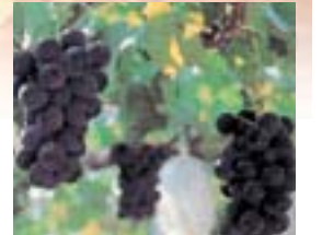
巨峰 ブドウの王様、巨峰は甘く新鮮な味わいで天下第一と定評があります。