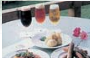
地ビール 最高級のモルト(麦芽)、ホップ、酵母を穏やかな気候と美味しい水によって醸造されたさわやかな飲み心地が自慢です。