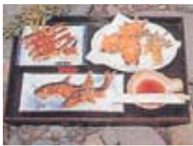
つけば料理 ハヤ(ウグイ)の種付け場が名前の由来。川魚料理を提供しますが、設置する場所は年によって変わります。これは漁師の永年の経験と勘がものをいいます。